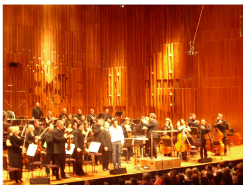
UK Première de les ' Set Escenas de Hamlet ' (BBC Symphony Orchestra, dir. J. Pons; London, Barbican, 2008)