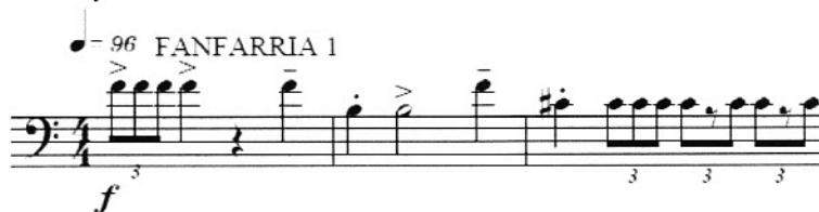
Partitura 21: Compases 1-3. Carisero Cardo. Diago, E.