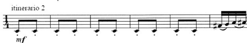
Partitura 22: Compases 42-47. Carisero Cardo. Diago, E.