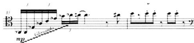
Partitura 19: Compases 85-86. Carisero Cardo. Diago, E.

En los compases 85-86 podemos ver la parte más aguda de la pieza: